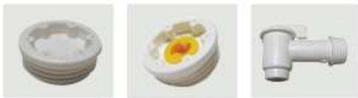
Bonde 2" jointé PE